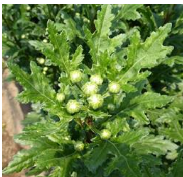
図1.アザミウマ類による 葉のケロイド症状

生育期に成・幼虫が生長点付近に寄生して吸汁するため、展葉してきた葉にケロイド症状が発生します(図1)。特にミカンキイロアザミウマなどは花を好んで食害し、花弁にカスリ状の小斑点を生じたり変色させるため、切り花の商品価値を著しく低下させます。蕾の膜切れ後に侵入すると、薬剤がかりにくいため防除が困難になります。露地では5〜7月と9月に被害が多くなります。